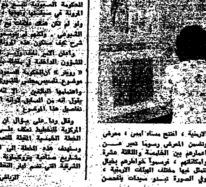
لوحات لأطفال أرمن

أما عندنا في لبنان، فإن الأمر ليس نقياً المطلق، وعلى خلاف ما يجري في الدنيا بأسرها، ذلك أن السلطة لا تكفي بالإنقاذ من عدم الصحافة، وإنما تتناول دائماً أن تتهاوى وتتلها.